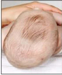
تسطح حاد في الرأس