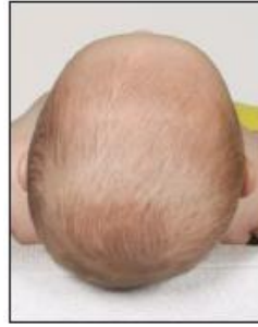
تسطح طفيف في الرأس