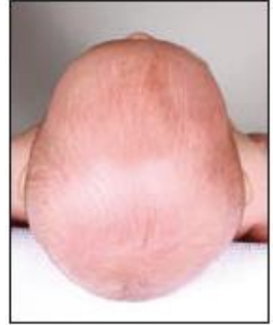
شكل الرأس الطبيعي