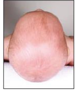
شكل الرأس الطبيعي