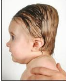
قصر حاد في الرأس