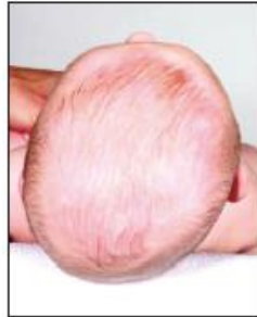
تسطح متوسط في الرأس