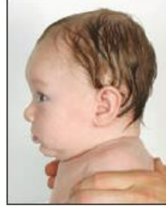
قصر طفيف في الرأس